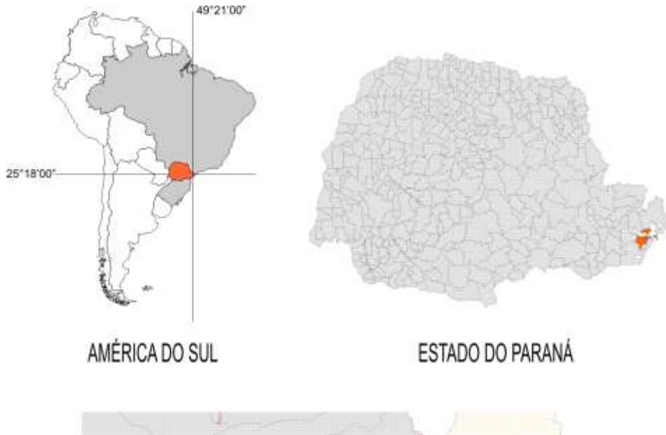
Figura 1: Localização da área de estudo

Paranaguá e Antonina (260 km 2 ) e as baías de Laranjeiras e Pinheiros (200 km 2 ) (LANA, 2000).