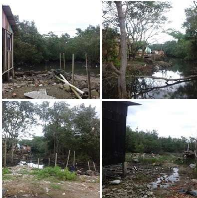
FIGURA 3: Residências irregulares e em situações precárias no Bairro Beira Rio

Segundo o biólogo o manguezal não corre risco de extinção, apesar da área que abrange ele consegue se revitalizar. Para ocorrer uma fiscalização de invasão irregular, primeiramente deve haver uma denúncia para averiguação, após é lavrado em ata no ministério público e então inicia-se a recuperação do dano. As punições para quem invade essas áreas são realizadas pelo ministério público, podendo ocorrer prisão e multa.