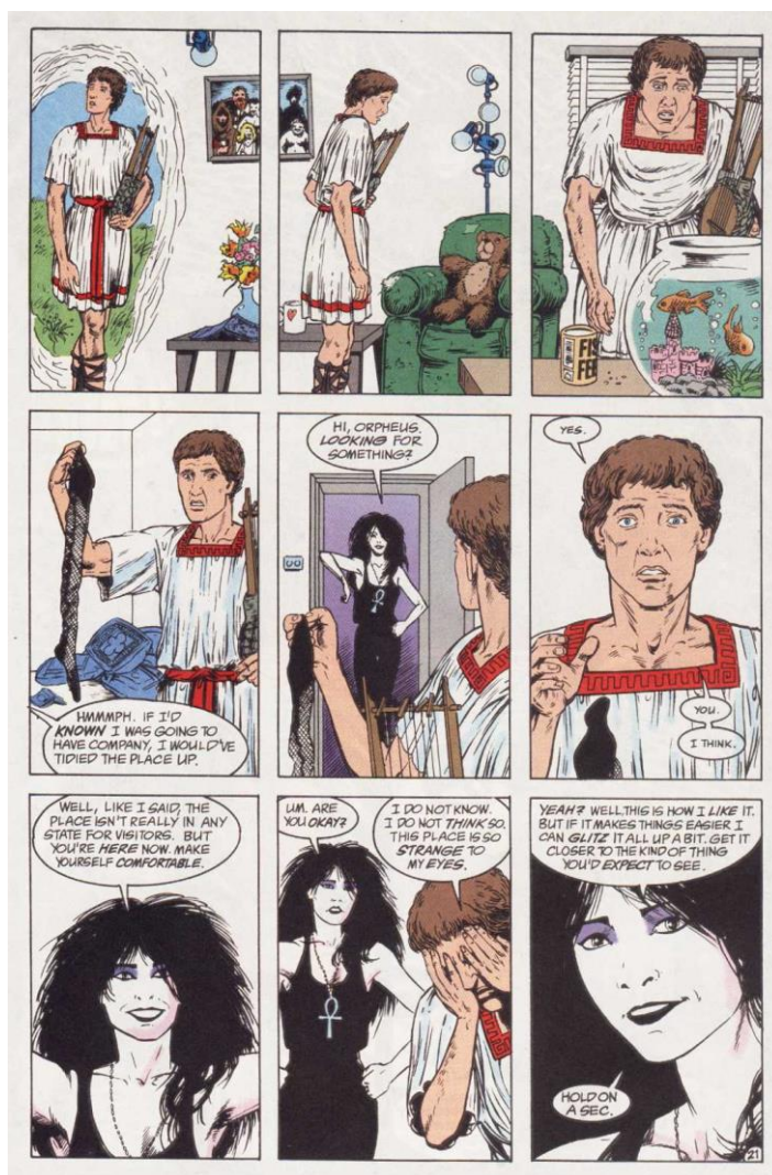
Fig.4 – Orfeu e sua tia Morte. Sandman – The Song of Orpheus . http://www.comicoo.com/sandman/Sandman29a

uma dimensão que parece estar situada nos anos 80. Este elemento por si só, seria inconcebível sob a perspectiva Aristotélica no sentido que talvez a percepção de passado e futuro fosse diferente para os gregos antigos, ou seja, se não fosse por este detalhe, essa mesma história poderia ter sido contada aos contemporâneos de Aristóteles sem que estes realmente questionassem o que lhes fosse narrado, tendo em mente o que filósofo dizia em relação ao dever do poeta de contar o que foi ou o que poderia ter sido.