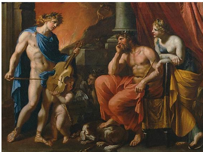
Fig. 1 Orphée devant Pluton et Proserpine d'après François Perrier © Musée du Louvre. Fonte: http://skai-orphee.eurydice.over-blog.com/pages/LE_MYTHE_DORPHEE_ET_EURYDICE-6006194.html

Inconformado com o acontecimento, Orfeu decide descer ao inferno na tentativa de convencer Hades e sua esposa Perséfone a lhe restituírem Eurídice e para convencê-los, o músico canta a mais linda canção de amor jamais ouvida. A canção causou tamanha comoção que até as danaiades - filhas de Dânao, condenadas à eternidade enchendo vasos que nunca ficam cheios no Hades por terem matado seus maridos na noite de núpcias - descansaram de seu fardo eterno de encherem tonéis sem fundo, a roda de Íxion - Íxion foi um grande vilão mitológico condenado a queimar em uma roda de fogo pela eternidade - parou de rodar e foi capaz de convencer Hades e Perséfone a lhe darem a chance de recuperar Eurídice.