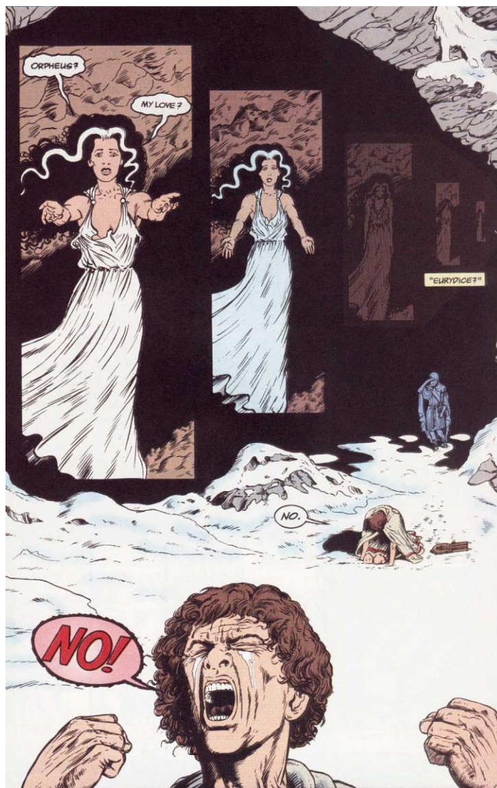
Fig.5– Orfeu e Eurídice na saída de Hades. Sandman – The Song of Orpheus.

Em A canção de Orpheus , após ter retornado sem sua amada, Orfeu se isola e nunca mais se interessa por ninguém, fato este que se assemelha à versão original, porém, nesta trama, Calíope tenta convencer seu filho a voltar ao convívio das pessoas e o alerta para a chegada das Bacantes (Adoradoras de Dionísio conhecidas por seus hábitos promíscuos e selvagens). Orfeu se mostra indiferente ao aviso da mãe, acaba sendo devorado por elas e tem sua cabeça lançada ao rio, onde chamaria por Eurídice eternamente.