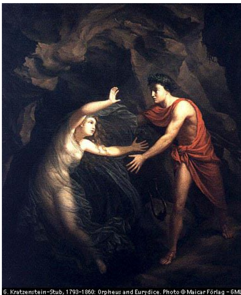
Fig. 2 – Orpheus and Eurydice. G.Kratzenstein-stub. http://www.artmony.biz/t3137-mythologie-imagerie-classique

Dizem que após ter retornado do mundo das sombras, Orfeu não se interessou por mais ninguém e sua fidelidade à esposa morta teria provocado a ira das mulheres trácias que sofriam com sua rejeição e por isso, teriam lhe cortado em pedaços e jogado sua cabeça no rio. Sua cabeça flutuante chamou por Eurídice em um eco sem fim: