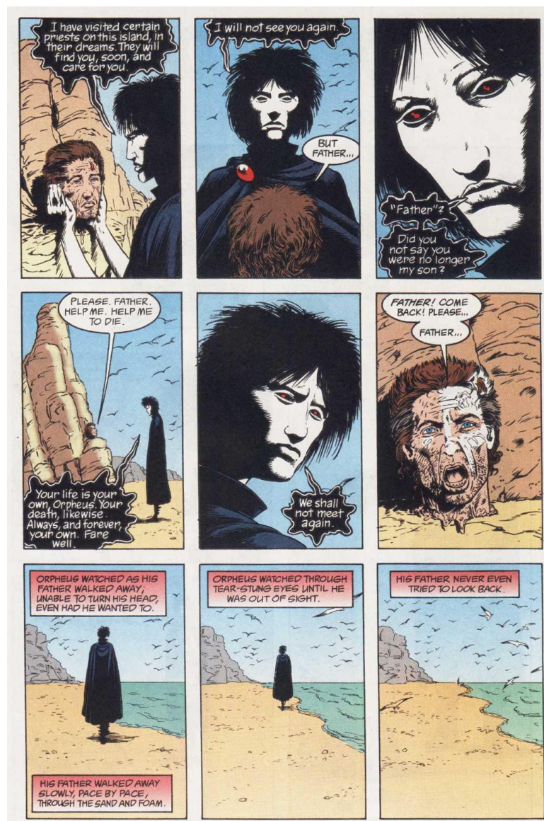
Fig.6 – Morfeu deixando Orfeu – Sandman – The Song of Orpheus. http://www.comicoo.com/sandman/Sandman29a