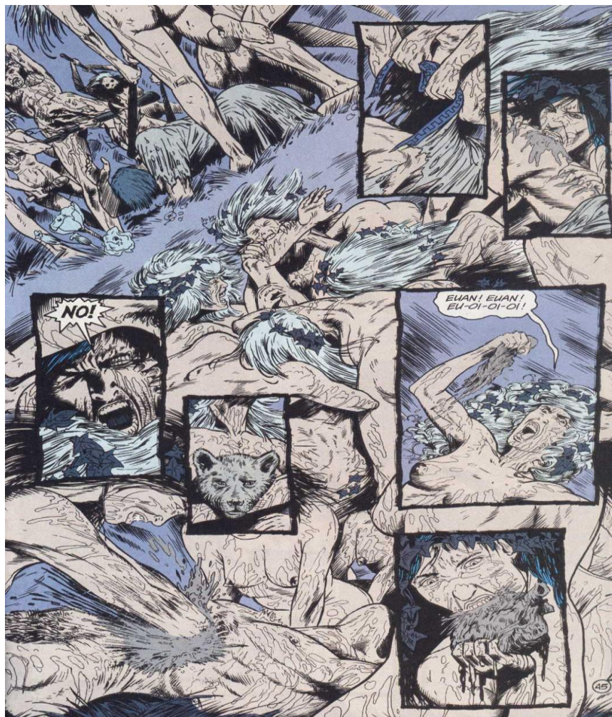
Fig.5 – Orfeu sendo devorado pelas Bacantes – Sandman – The Song of Orpheus . http://www.comicoo.com/sandman/Sandman29aue

Em uma das versões mais conhecidas, Orfeu também teria sido devorado, porém, pelas mulheres trácias enciumadas com sua rejeição e nada mais se sabe além de sua cabeça ter sido levada pelo rio, ainda chamando pelo nome de sua esposa.